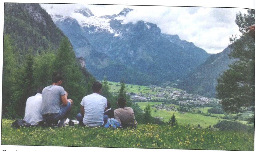
Querbeet - Intercultural hiking above the rooftops of the Lofer mountain community.

In the case of Austria, there is currently a positive net migration of 667,000 people (immigration minus emigration). According to projections, the population will rise from about 8.7 million people to 9.4 million by 2030. As a result of immigration, the number of people born abroad who live in Austria is increasing. Here, we are talking about two million people, while the native-born population remains relatively constant at around 7.1 million. It is just this point that presents an interesting picture in relation to regional and urban development. While the future number of foreign-born nationals will grow more or less strongly in all regions, an increase in domestic births is only expected in high-growth regions. There, where the population is shrinking, it is exclusively the number of Austrian-born individuals that is decreasing (APA/Statistics Austria/ÖROK 2017).