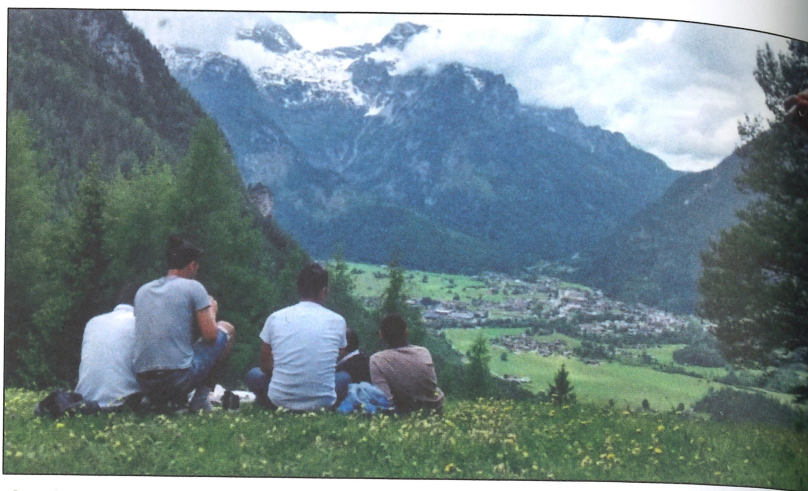
Querbeet – Interkulturelle Wanderung, über den Dächern der Berggemeinde Lofer.

Am Beispiel von Österreich zeigt sich bei der Wanderungsbilanz (internationale Zuwanderung minus Abwanderung) aktuell ein Plus von 667.000 Personen. Laut Prognose wird die Bevölkerung bis 2030 von zurzeit knappen 8,7 Millionen auf 9,4 Millionen Personen steigen. In Folge der Zuwanderung steigt vor allem die Zahl der im Ausland Geborener. Hier sprechen wir von zwei Millionen Menschen, während die im Inland geborene Bevölkerung bei etwa 7,1 Millionen relativ konstant bleibt. Gerade an diesem Punkt zeigt sich für die Regional- und Urbanentwicklung ein interessantes Bild. Während künftig die Zahl der im Ausland Geborenen bundesweit in allen Regionen mehr oder weniger stark zunehmen wird, ist ein Anstieg der im Inland Geborenen nur in den starken Wachstumsregionen zu erwarten. Dort, wo die Bevölkerungszahl schrumpft, nimmt ausschließlich die Zahl der im Inland geborenen Personen ab. (Vgl. APA/Statistik Austria/ÖROK 2017)