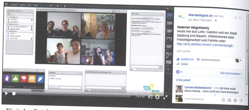
„Digitaler Querbeettag“, 15. September (internationaler Tag der Demokratie).