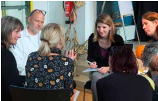
Workshop „Vital Village“